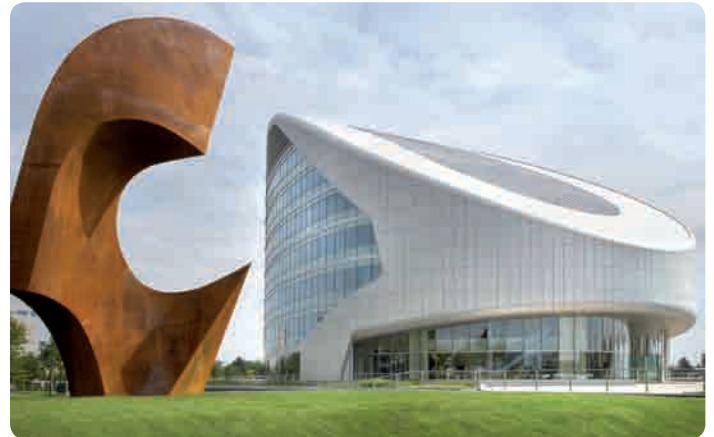
SABIC Europe Zentrale in Sittard, Niederlande

SABIC Europe verantwortet alle Geschäftsaktivitäten rund um Polyolefine für den europäischen Markt mit einer jährlichen Produktionskapazität von rund 8,7 Mio Tonnen.